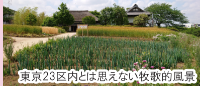
東京23区内とは思えない牧歌的風景

お待ちどう様。毎年、桜の季節といえばここ「足立農業公園」。おなじみのコースとなっていますが、年に1回だから意外と新鮮、新たな発見があったり楽しいですね。えっ！なんですって、このプログラムはお寿司が食べられるから好き！なんて言ってる人。たまにはお寿司を止めてレストラン2Fのオリジナルランチ食べてみませんか？健康に良さそうなメニューでしたよ。