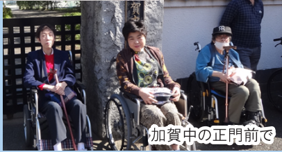
加賀中の正門前で

こうした取組み以外にもおむすびでは年に1~2回「池袋防災館」で本格的な地震対策訓練にも参加しています。