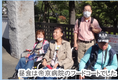
昼食は帝京病院のフードコートでした