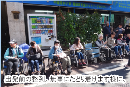
出発前の整列。無事にたどり着けます様に。

こうした取組み以外にもおむすびでは年に1~2回「池袋防災館」で本格的な地震対策訓練にも参加しています。